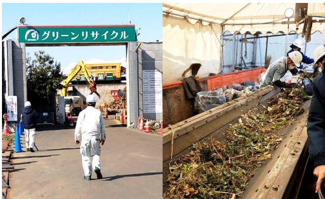
茅ヶ崎リサイクル施設と混入物の除去作業の様子

その施設の隣には2021年から稼働している茅ヶ崎バイオマス発電所があり、作られたチップを燃料として発電し、茅ヶ崎市などへ電力も供給しています。このように、植木剪定材は非常にリサイクルに適した価値あるごみ資源です。