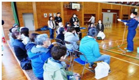
防災訓練のロープワーク