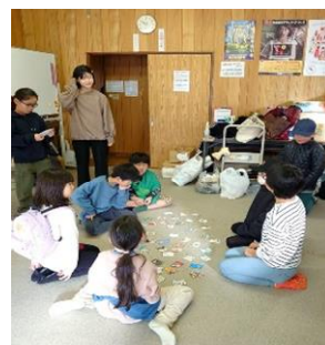
楽しいカルタ遊び