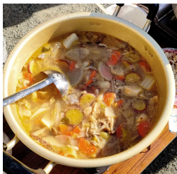
豚汁おいしくできあがりました。