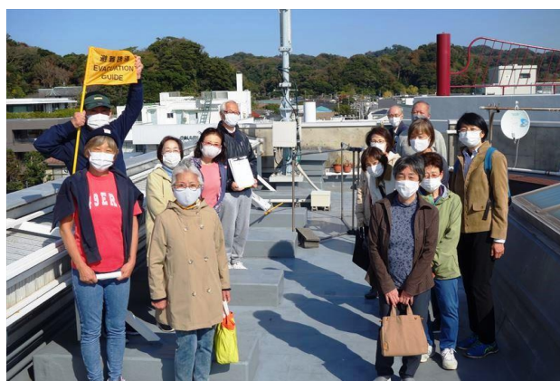
津波避難訓練・津波避難ビル屋上見学