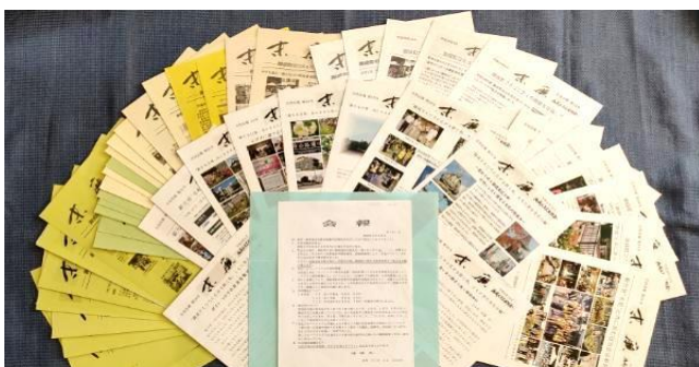
会報「末廣」1号から59号までの足跡