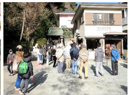
大人も子どもも大集合