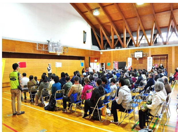
令和5年度御成小学校校区防災訓練

東日本大震災から今年で13年、今年1月1日元旦に発生した能登半島地震は未だ復興半ばの記憶に新しい大きな災害でした。