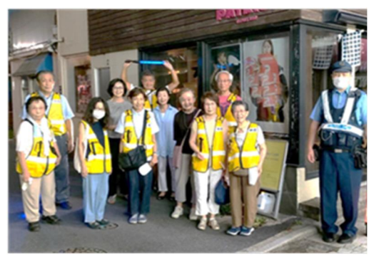
昨年夏の防犯パトロール

* 自治会地域の防犯状況を知る貴重な機会でもあります。防犯パトロールに班長他会員 皆さまの参加協力をお待ちしています。