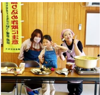
豚汁おいしくできるかな？

自治会の皆さんと一緒に、子供たちもママと豚汁を作ったりカルタ遊びをしたり、元気に境内を走ったりと、食べて遊んで楽しいひと時をすごしました。