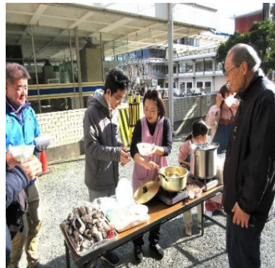
おかわりもでた豚汁