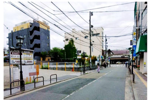
ホテル建設予定地 奥に鎌倉駅西口をのぞむ