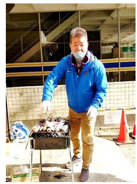
ホクホク焼き芋は人気