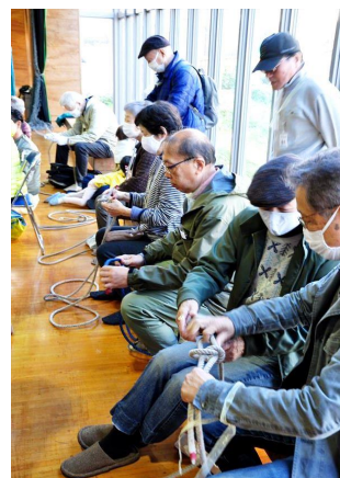
真剣にロープワークに取り組む参加者