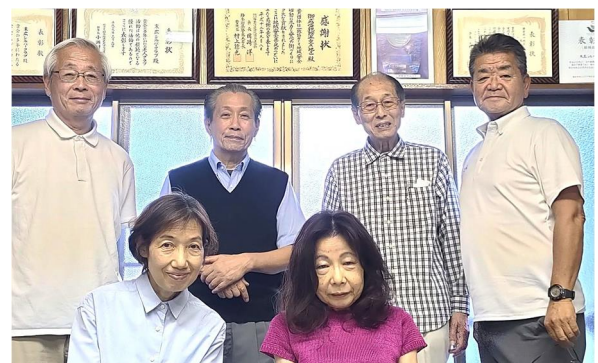
会報編集委員の面々